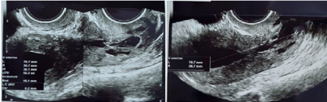
Figura 2. Ecografía transvaginal posterior a la toma de misoprostol. Cavidad endometrial ocupada por contenido anecoico que mide 16.1 mm de espesor en todo su trayecto. Cervicometría 9.2 mm.

Se realiza estudio ecográfico el cual reporta cervicometría de 9.2 cc, se aprecia cuello uterino atrófico, se decide alta y reprogramación quirúrgica.