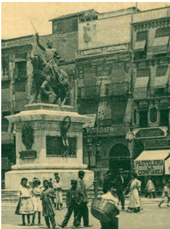
❖ Fachada de “Esteve Puig, Fotografía Artística”, en la plaza de Prim de Reus, entre 1903 y 1908.