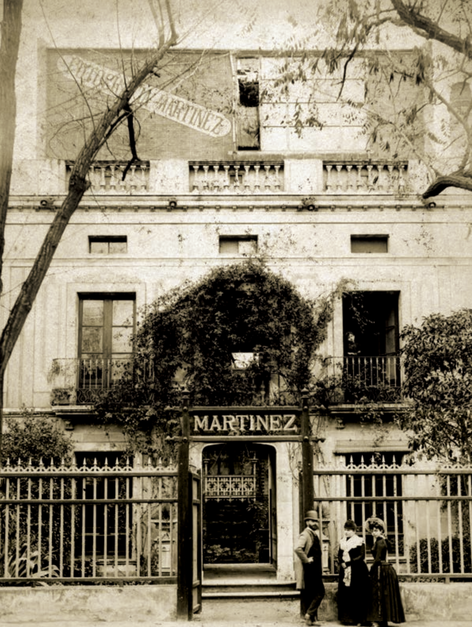
Establecimiento del fotógrafo M. Martínez, en el Paseo Mata de Reus, en funcionamiento, entre 1881 y 1895.