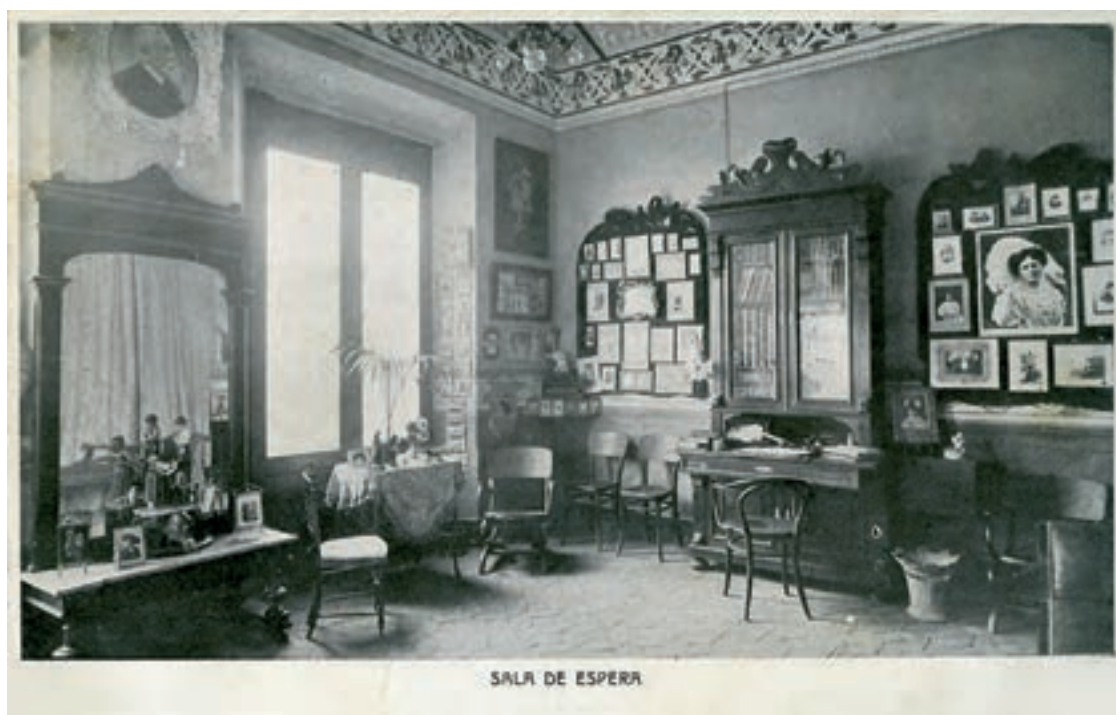
🐞 Sala de espera del establecimiento “Esteve Puig, Fotografia Artística” en la calle de Monterols de Reus, en 1908. (CP)

Aunque algunos de los fotógrafos que hemos ya visto en el siglo XIX prolongan su actividad en los primeros años del XX, como Fotografía Torres, serán otros nuevos los que protagonicen la fotografía local hasta el final de la década de 1930, junto con Fotografía Puig de F. Solà: entre los profesionales, Fotografía Niepce, Santonja, Solà, Valveny, Amer, etc. Y entre los aficionados encontramos una nueva generación de altísima calidad: Eduard Borràs, Manuel Cuadrada, Josep Prunera Sedó y Fèlix Ruiz García.