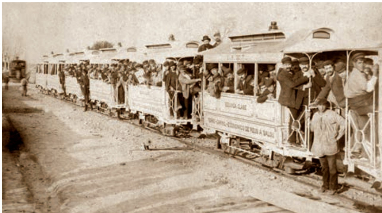
MIQUEL MARTÍNEZ, fotógrafo. Viaje inaugural del ferrocarril de Reus-Salou el 29 de enero de 1887. (CIMIR)

En 1882 anuncia “Retratos novedad, 12 retratos medallón entregados en el acto, 4 reales, 12 retratos de media tarjeta 20 reales, y 12 a tarjeta entera 30 rals, a mas de fotografias de todos tamañs a precios convencionales. Se retratan difuntos” . En 1894, insistía en “precios sin competencia” , y en enero de 1895, también en Diario de Reus anuncia una oferta extraordinaria: “Durante 30 días ofrece RETRATOS DE BALDE a todos sus favorecedores, y al público en general, a excepción hecha de los días festivos, solo pagando los encargos por adelantado” .