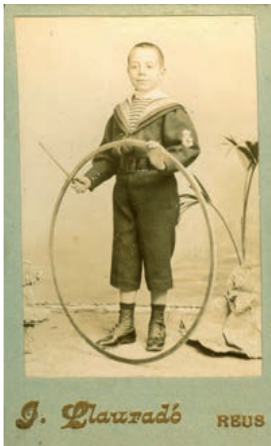
Fotografía tarjeta de visita, c.1895-1897.