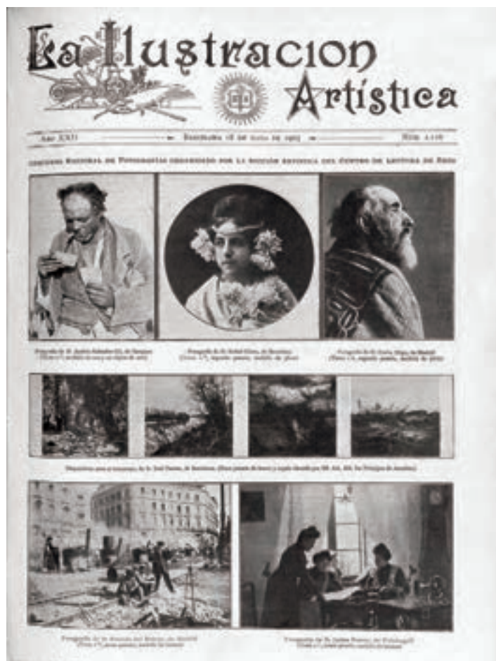
La Ilustración Artística (Barcelona) 18-V-1903, dedicada al Concurso Nacional de Fotografías de Reus. (CP)