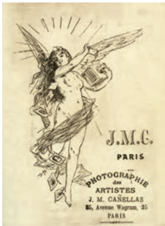
📷 Fotógrafo Josep María Cañellas. Reverso de fotografía, París, c.1900. (CP)

Recordemos además que París siempre fue la ciudad de referencia en el mundo de la fotografía y amenudo los fotógrafos con galerías estables en la ciudad informaban al público de sus viajes a París para comprar máquinas o aprender nuevas técnicas o de las medallas o distinciones que habían ganado.