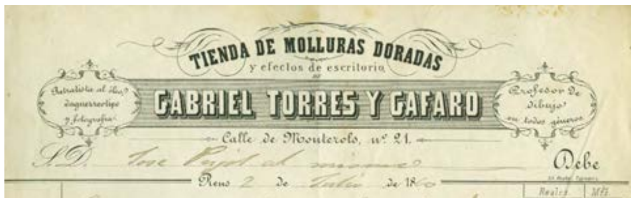
Factura del fotógrafo Gabriel Torres, conservada en el Arxiu Comarcal del Baix Camp-AMR, (Cataluña).