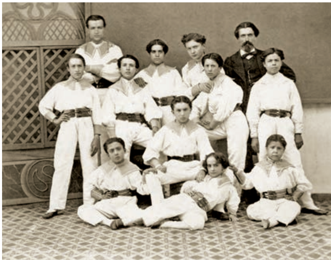
📷 Fotógrafo desconocido. Una clase de gimnasia, en Reus. Es la fotografía de grupo más antigua conservada en la ciudad, del 2 de abril de 1868. (CIMIR)

naba encargos de fototipia y fotograbado, los dos principales métodos de impresión de imágenes y tarjetas postales ( Las Circunstancias , 8-V-1896). En 1897 anuncia en los diarios locales Lo Somatent , Diario de Reus y La Autonomía , que se retrata “ todos los días y con todos los tiempos ” y “ nuevas fotografías en colores ”. 6 En el año 1900 Torres se traslada a un local en la calle Castelar 28, donde en los bajos eran destinados a exhibiciones de fotografías. El 1901 se anuncia como Gran Fotografía Torres y ofrece “ Vistas de Reus en Tarjetas Postales ” y en 1903 “ Retratos en tarjeta postal ” y “ fotografías gran novedad al platino, retratos instantáneos, ampliaciones y reproducciones en todos tamaños y procedimientos ” ( Semanario Católico , 1903).