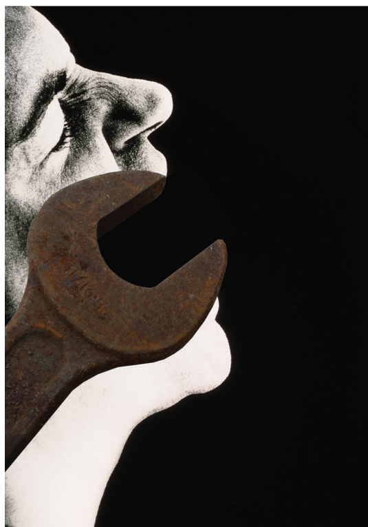
Fig. 2. Cartel "Pain Work", creado por el diseñador Christopher Scott.

los términos de representación de dicha empresa y la forma en que se perciben en el área de pensamiento consciente social, los valores se han adaptado en el modelo de negocio y la marca al mostrar que piensan más en el cliente y no sólo en el método de hacer la mayor cantidad de dinero que sea posible.