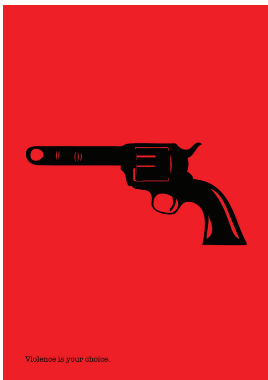
Fig. 1. Cartel "Finger gun", creado por el diseñador Christopher Scott.